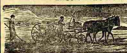
2- és 3-vasú ekék és minden egyéb gazdasági gépek.

2 1/2 egész 12 lóerőig, számkazalozók, konkolyozók, kaszáló- és aratógépek, szénagyűjtők, boronák.